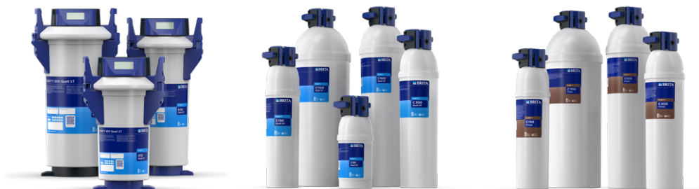
PURITY Quell ST

Ecco una panoramica della gamma completa di prodotti per il filtraggio PURITY, pensati appositamente per le macchine per la distribuzione automatica. BRITA Professional ha la soluzione giusta per te: fornisce l'acqua ideale per le tue esigenze, a prescindere dalla composizione dell'acqua nella zona.