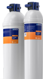
PURITY C Steam