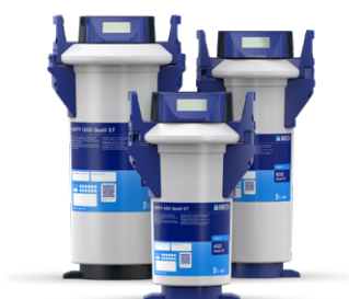
PURITY Quell ST