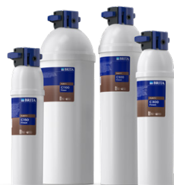
PURITY C Finest