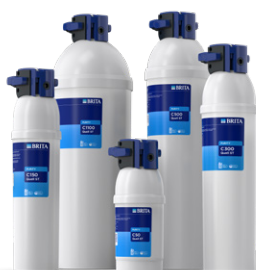
PURITY C Quell ST